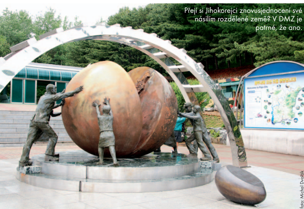
Přejí si Jihokorejci znovusjednocení své násilím rozdělené země? V DMZ je patrné, že ano.