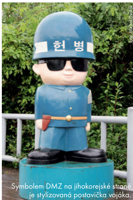
Symbolem DMZ na jihokorejské straně je stylizovaná postavička vojáka.

Čtvrtý tunel byl zatím poslední. Víc se jich nenašlo. Když ale Kim Ir-sen nařídil jejich ražení, tak mluvil o dvou tunelech na každou divizi. Ovšem tenkrát bylo podél DMZ divizí jedenáct, teoreticky by tak pod hranicí mohlo vést dalších osmnáct tunelů v různé fázi výstavby. Jihokorejci mají už dlouho vytipováno několik míst, kudy by mohly procházet, ale chybějí konkrétní důkazy, které by ukázaly na jejich přesnou polohu. Ražba protitunelů je navíc nesmírně drahá.