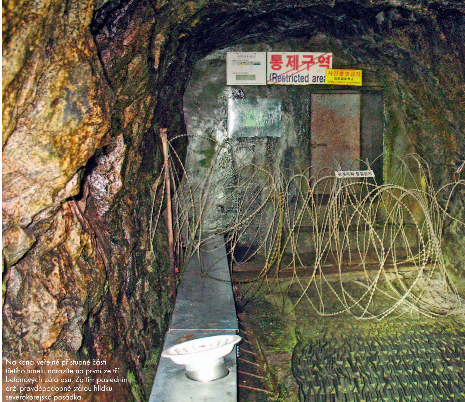
Na konci veřejně přístupné části třetího tunelu narazíte na první ze tří betonových zátarasů. Za tím posledním drží pravděpodobně stálou hlídku severokorejská posádka.

S everní a Jižní Korea jsou fakticky stále ve válce. Třiletý korejský konflikt totiž skončil v roce 1953 pouhým příměřím. A podle toho také hranice mezi těmito dvěma státy vypadá. Na obou stranách demarkační linie se rozprostírá dva kilometry široká demilitarizovaná zóna (DMZ), kterou střeží půl druhého milionu severokorejských, jihokorejských a amerických vojáků. K demilitarizované zóně se v průběhu celé studené války upínaly pohledy celého světa,