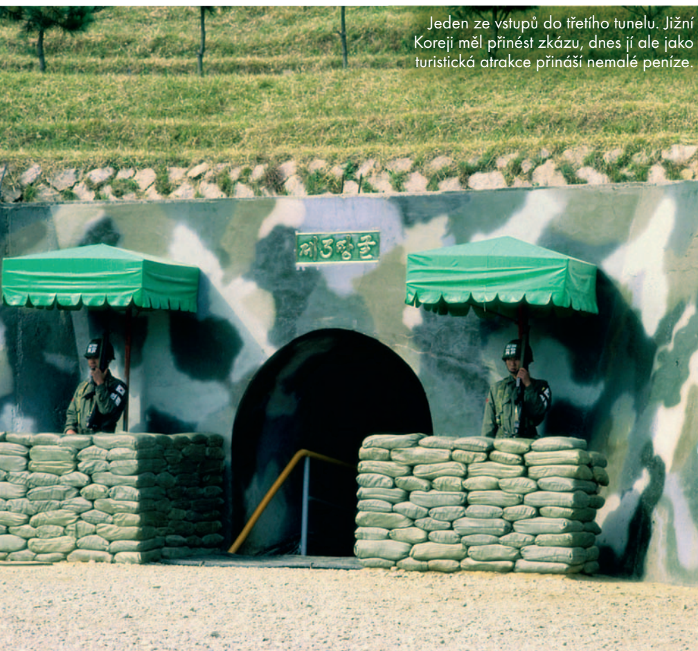
Jeden ze vstupů do třetího tunelu. Jižní Koreji měl přinést zkázu, dnes jí ale jako turistická atrakce přináší nemalé peníze.